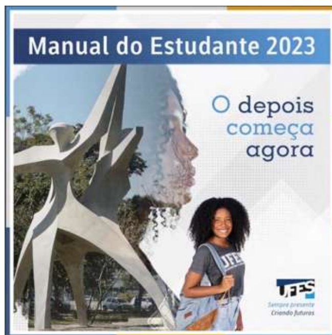
Figura 8 – Manual do Estudante ano 2023