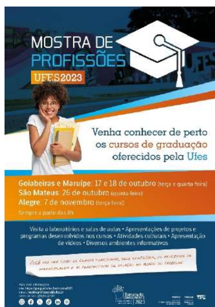
Figura 3 – Card de divulgação da Mostra de Profissões – Ufes 2023