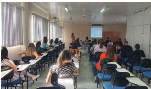
Figura 13 – Compilado de fotos dos encontros formativos

Na sequência, são apresentados registros fotográficos dos encontros realizados: