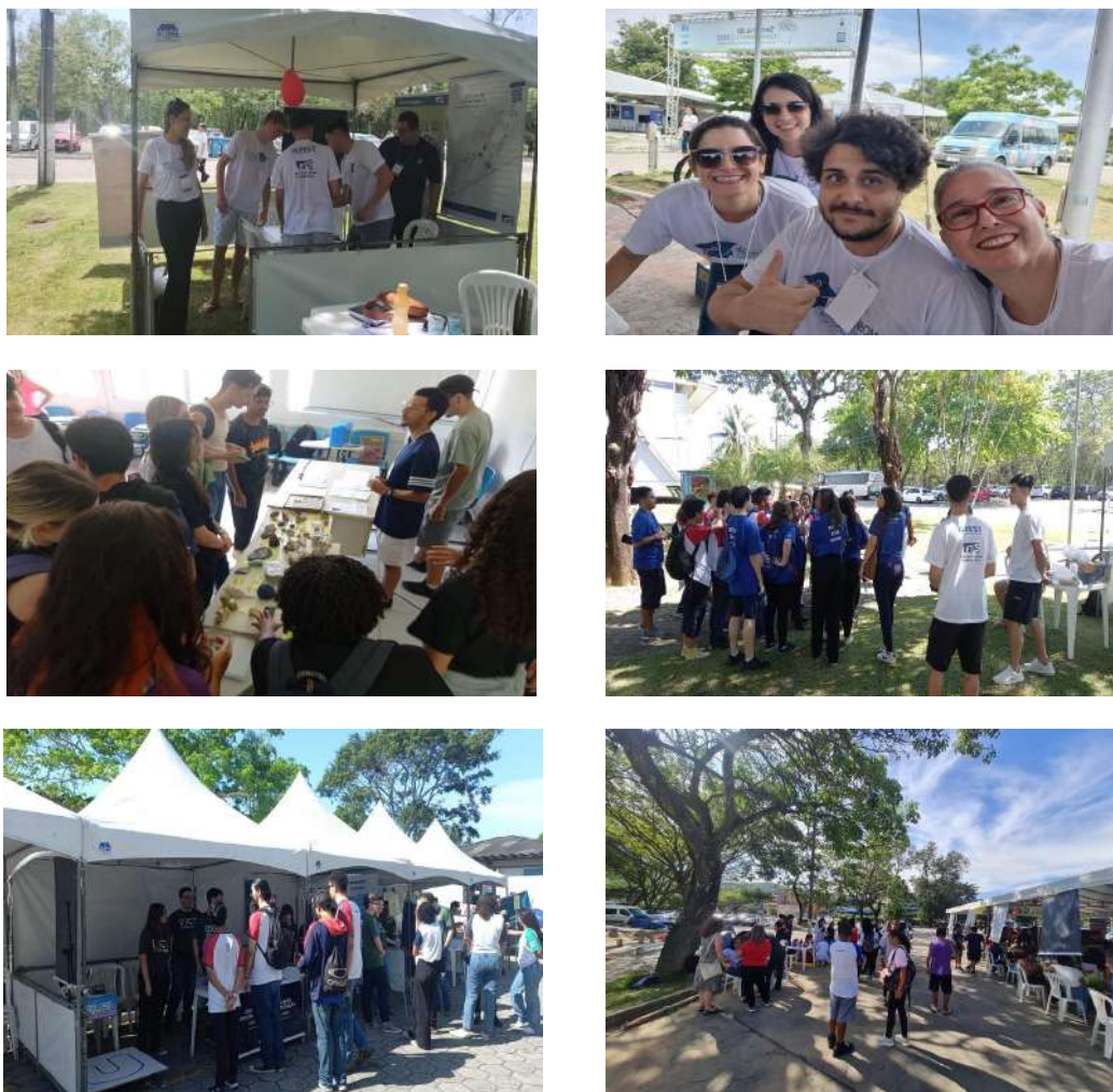
Figura 4 – Compilado de fotos da Mostra de Profissões em Goiabeiras e Maruípe (2023)

É importante notar que 319 escolas do Ensino Médio do estado do Espírito Santo e 19.610 estudantes se inscreveram para participar das atividades organizadas com muito cuidado pelos cursos. As imagens, na sequência, ilustram o ambiente de compartilhamentos, afetos e aprendizados, experimentado pelos estudantes do Ensino Médio e da Ufes nos dias da Mostra de Profissões: