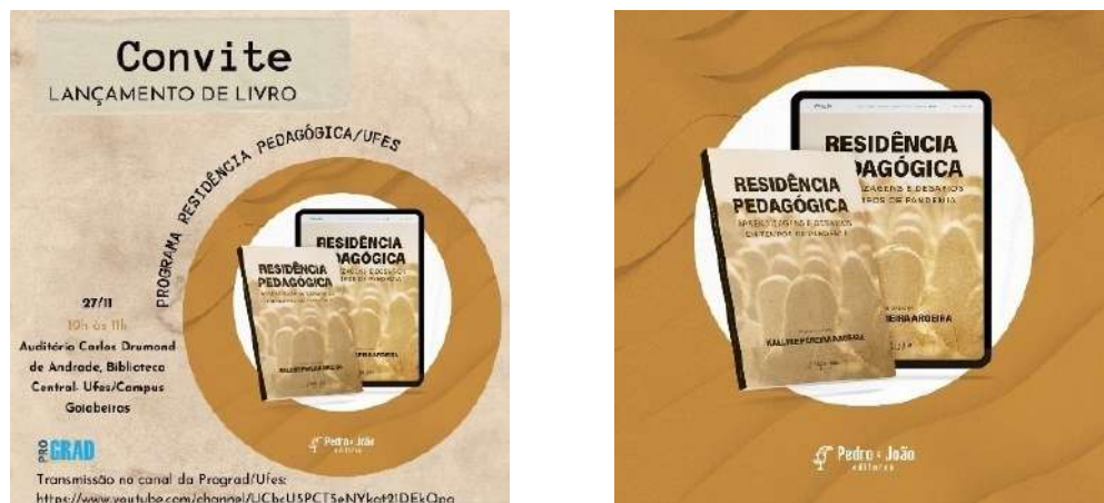
Figura 12 – Lançamento de livro do Programa Residência Pedagógica/Ufes