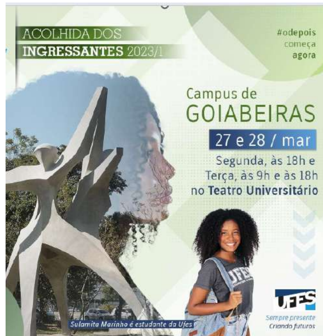
Figura 6 – Material de divulgação – Acolhida primeiro semestre de 2023