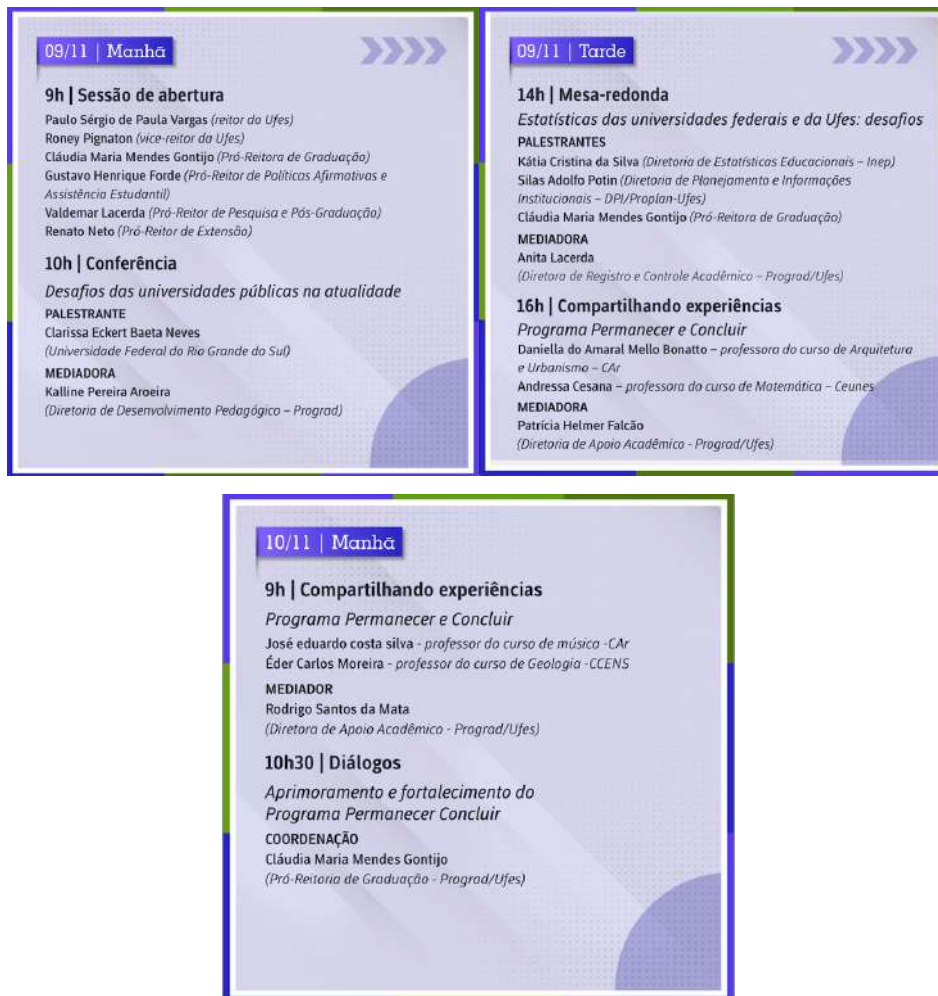
Figura 11 – Cards do Seminário Desafios das universidades públicas na atualidade (2023)