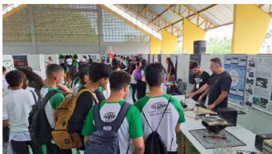
Figura 5 – Compilado de fotos da Mostra de Profissões em São Mateus e Alegre (2023)