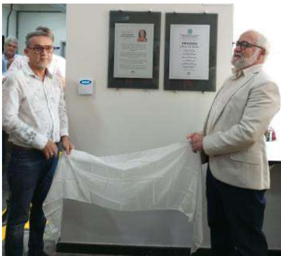
Figura 1 – Momento de descerramento das placas