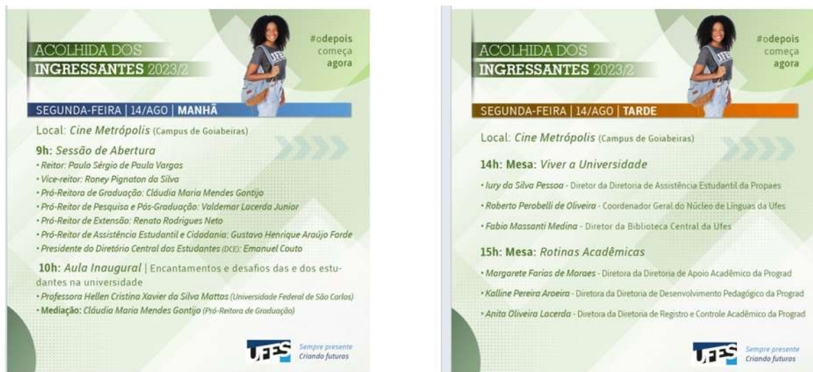
Figura 10 – Programação Acolhida dos Ingressantes 2023.2