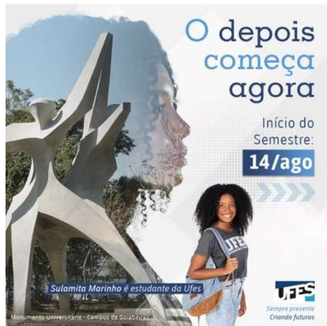
Figura 7– Material de divulgação – Acolhida segundo semestre de 2023