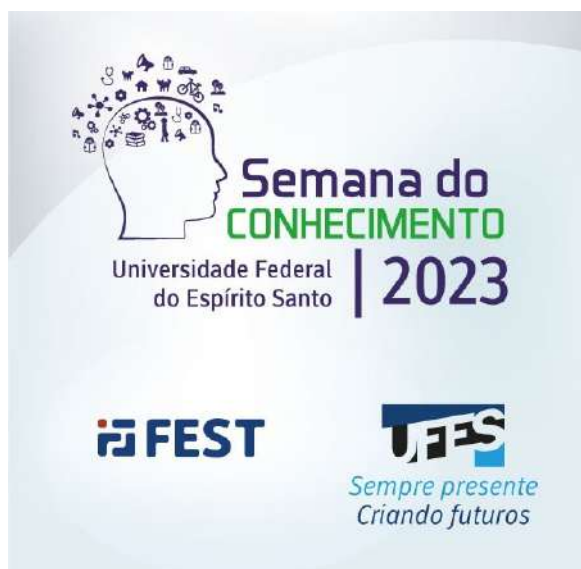
Figura 2 – Card de divulgação da Semana do Conhecimento (ano 2023)